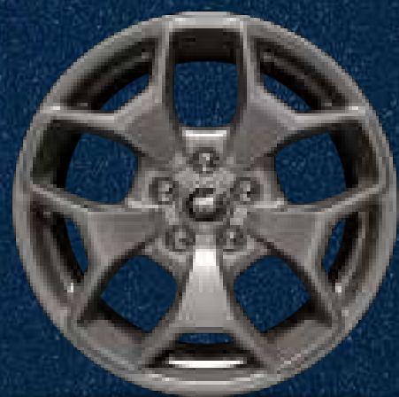
Rines Off-Road de Aluminio en Color Gris Carbono de 17"

4 Puertos USB de Carga Inteligente (2 Tipo A, 2 Tipo C)