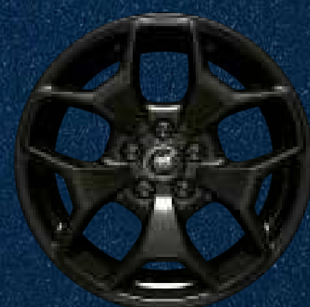
Rines Off-Road de Aluminio en Color Negro de 17"