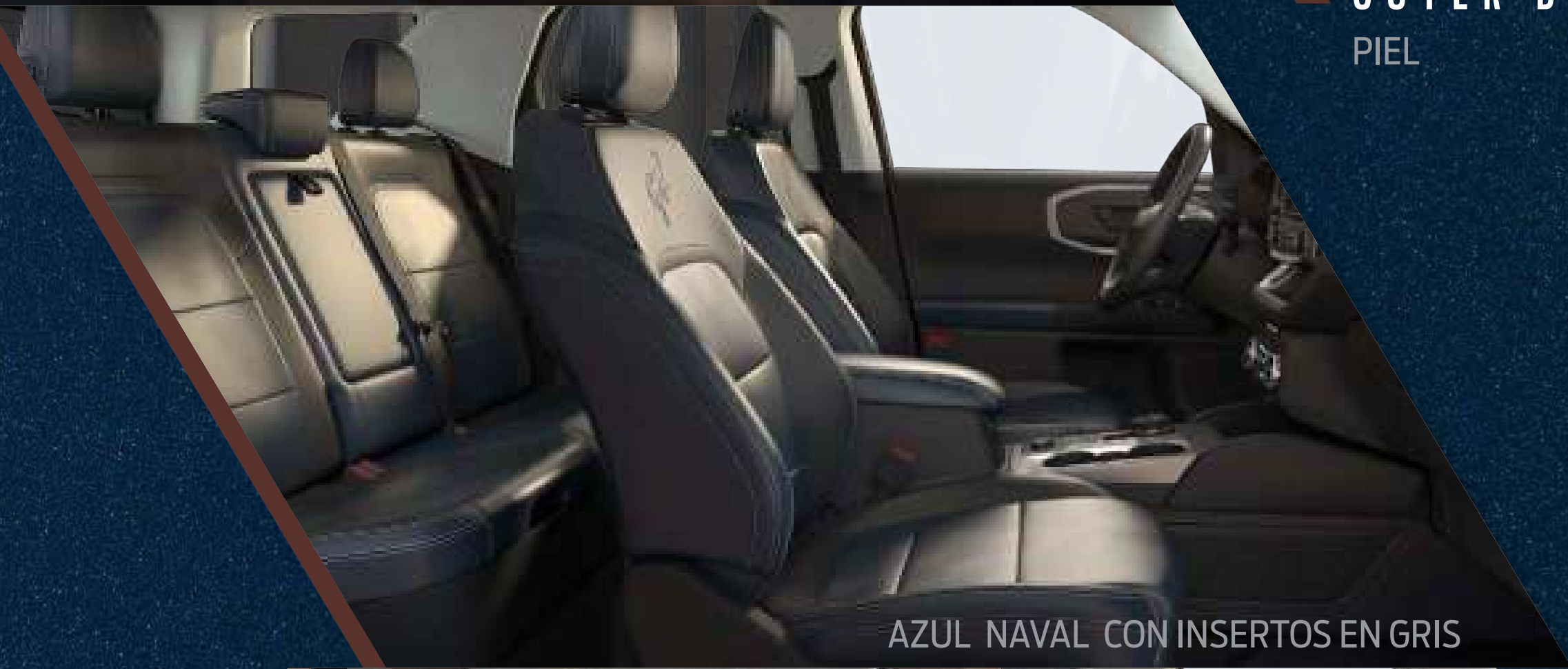
AZUL NAVAL CON INSERTOS EN GRIS