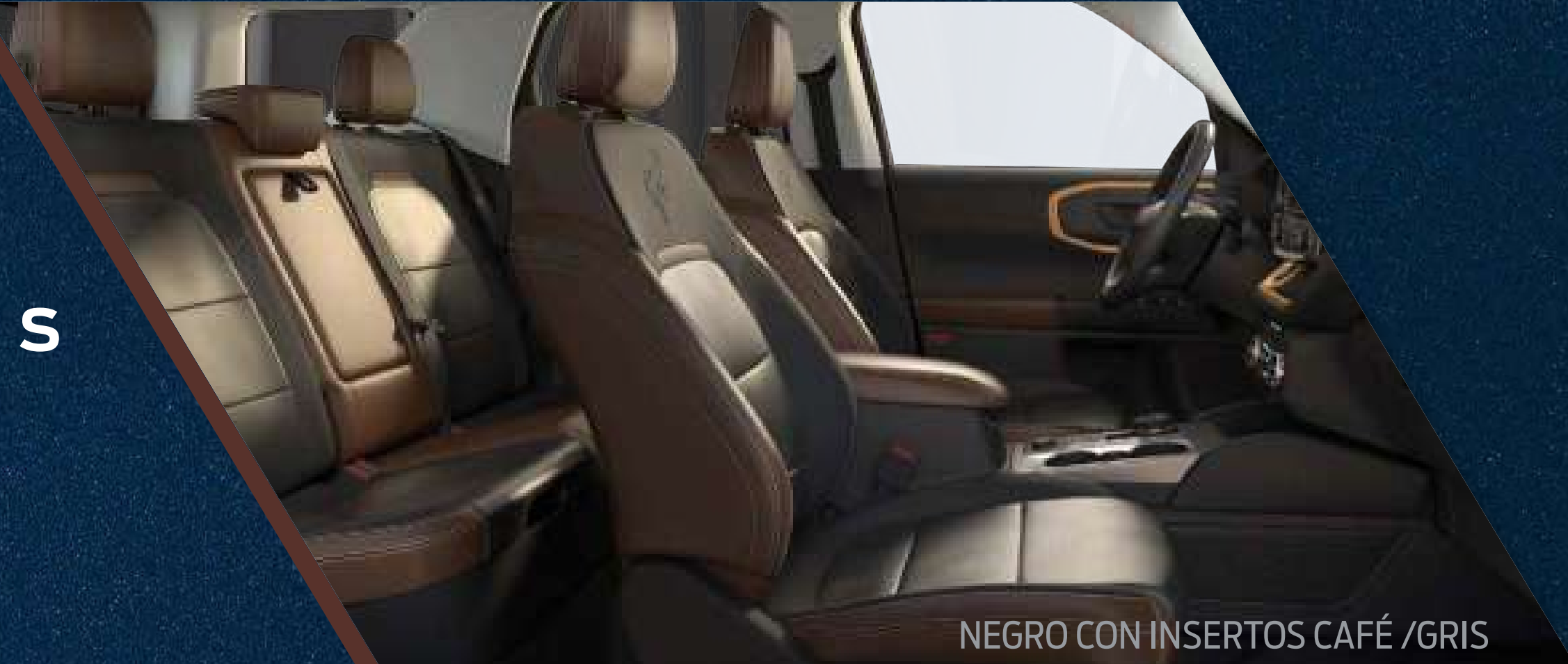
NEGRO CON INSERTOS CAFÉ /GRIS