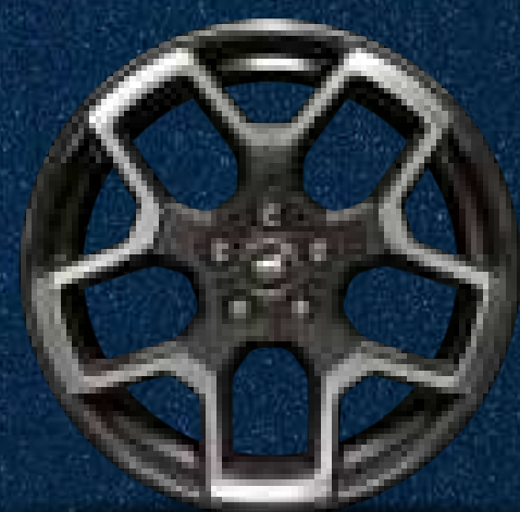
Rines Bi-Tono Negros de Aluminio Maquinado de 18"

Rines Bi-Tono Negros de Aluminio Maquinado de 18 Pulgadas (Llantas 225/60R18)