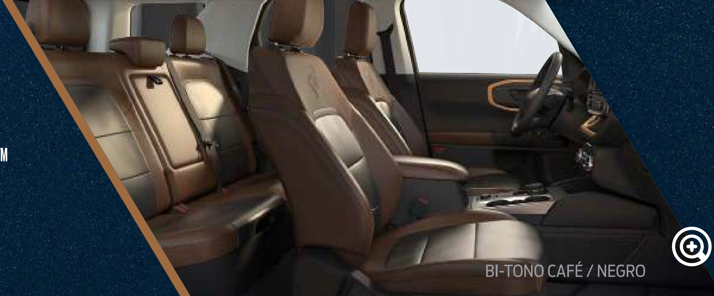
BI-TONO CAFÉ / NEGRO