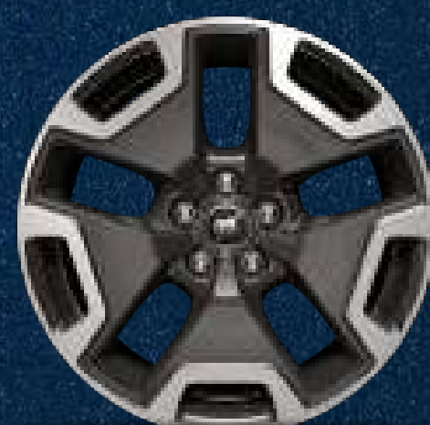
Rines Bi-Tono de Aluminio Cepillado de 18"

Rines Bi-Tono de Aluminio Cepillado de 18 Pulgadas (Llantas 225/60R18)